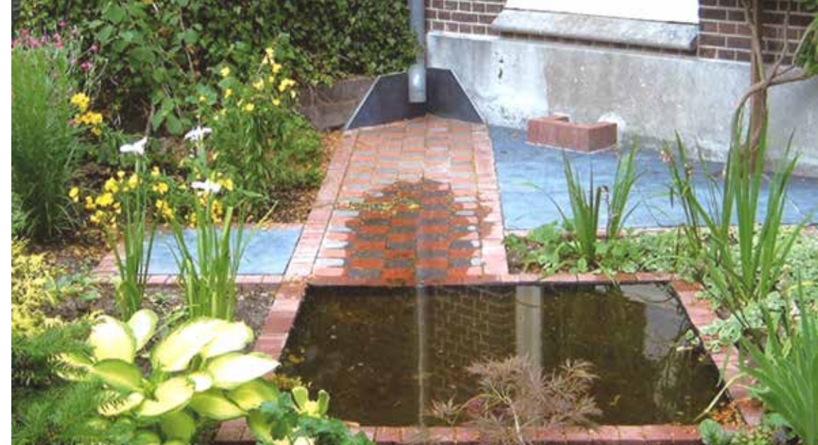
Geef een watergoot naar de infiltratieplek lichte afstroming. Water stroomt van hoog naar laag