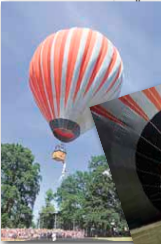
Deventer Op Stelten